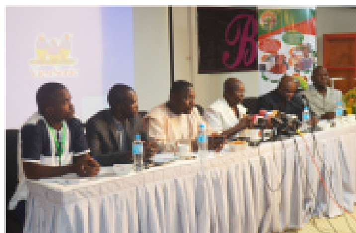
Présentation des réalisations du PRODEC en 2018 lors de la rencontre avec les responsables des médias au Niger

Etaient présents à cette rencontre une vingtaine d'acteurs du monde de la presse au Niger, les membres de l'Unité de Coordination du PRODEC et les représentants des trois agences d'exécution du PRODEC.