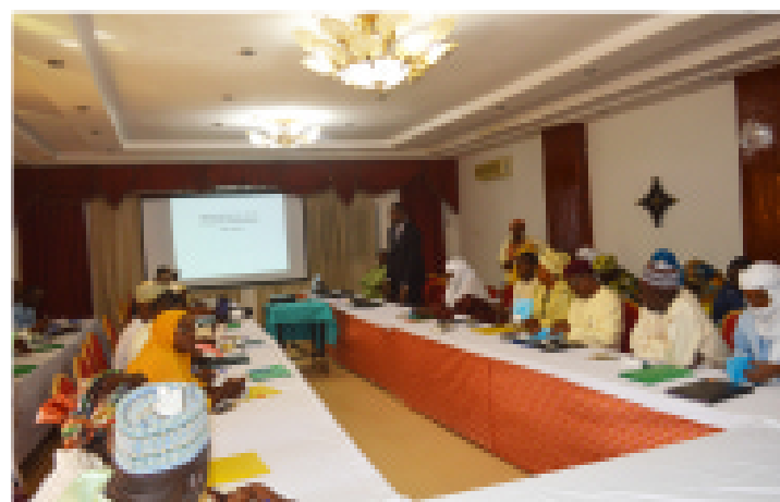
Atelier national de dissémination du concept des Sites d'Apprentissage Agricoles

Cet atelier entre dans le cadre de l'implantation de 10 Sites d'Apprentissage Agricole (SAA) par le Projet de Développement des Compétences pour la Croissance (PRODEC) et le Fonds d'Appui à la Formation Professionnelle et à l'Apprentissage (FAFPA) en 2019 dans les communes de ARUIT et TIMIA à Agadez ; MAINE SOROA et DIFFA à Diffa ; MADAOUA et BAGAROUA à Tahoua ; SAY et SAKIRA à Tillabéry ; KANTCHE et GOURE à Zinder.