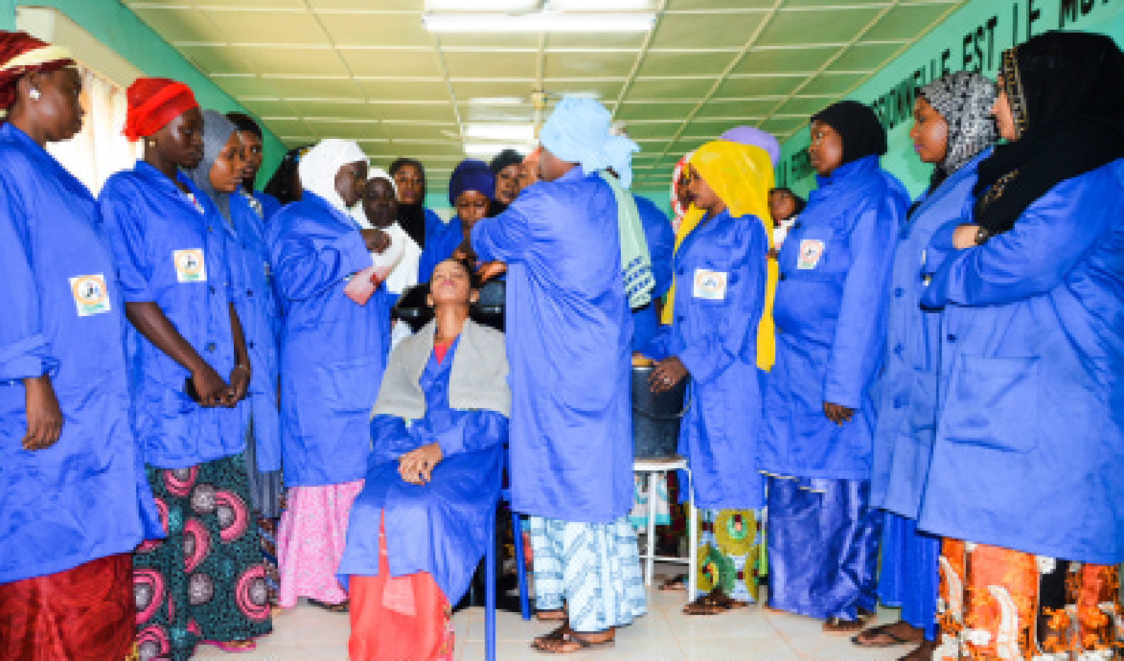
Évaluation des jeunes apprenties formées en coiffure par le PRODEC et le FAFRA – Niamey 2018