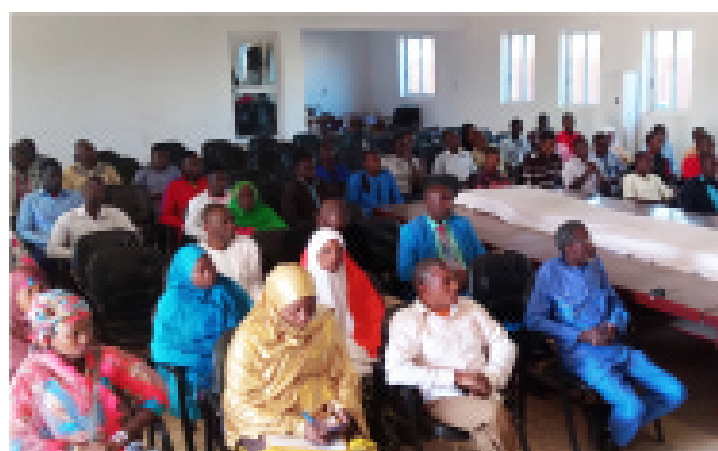
Jeunes diplômés de la région de Tahoua sensibilisés sur les formations en entrepreneuriat et la Compétition des Plans d'Affaires (CPA) du PRODEC et de la CCIN

Du 02 au 22 janvier 2019, la Chambre de Commerce et d'Industrie du Niger (CCIN), a organisé, avec l'appui du Projet de Développement des Compétences pour la Croissance (PRODEC) une mission d'information et de sensibilisation sur les modalités de mise en œuvre des activités de la sous-composante 2.3 du PRODEC « Promotion de la formation en entrepreneuriat », au titre du PTBA 2019. Cette mission d'information a sillonné toutes les régions du Niger.