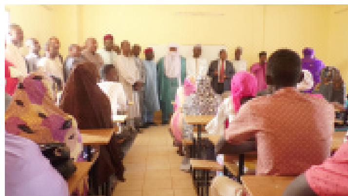
Rentrée de la 1ère promotion diplômante du CMCAN de Niamey en présence du Ministre des Enseignements Professionnels et Techniques et du Ministre du Tourisme et de l'artisanat

Le mardi 06 novembre 2018, a eu lieu la rentrée de la 1ère promotion diplômante du Centre des Métiers de Cuis et Arts de Niamey (CMCAN) qui constitue également la première après la restructuration dudit Centre.