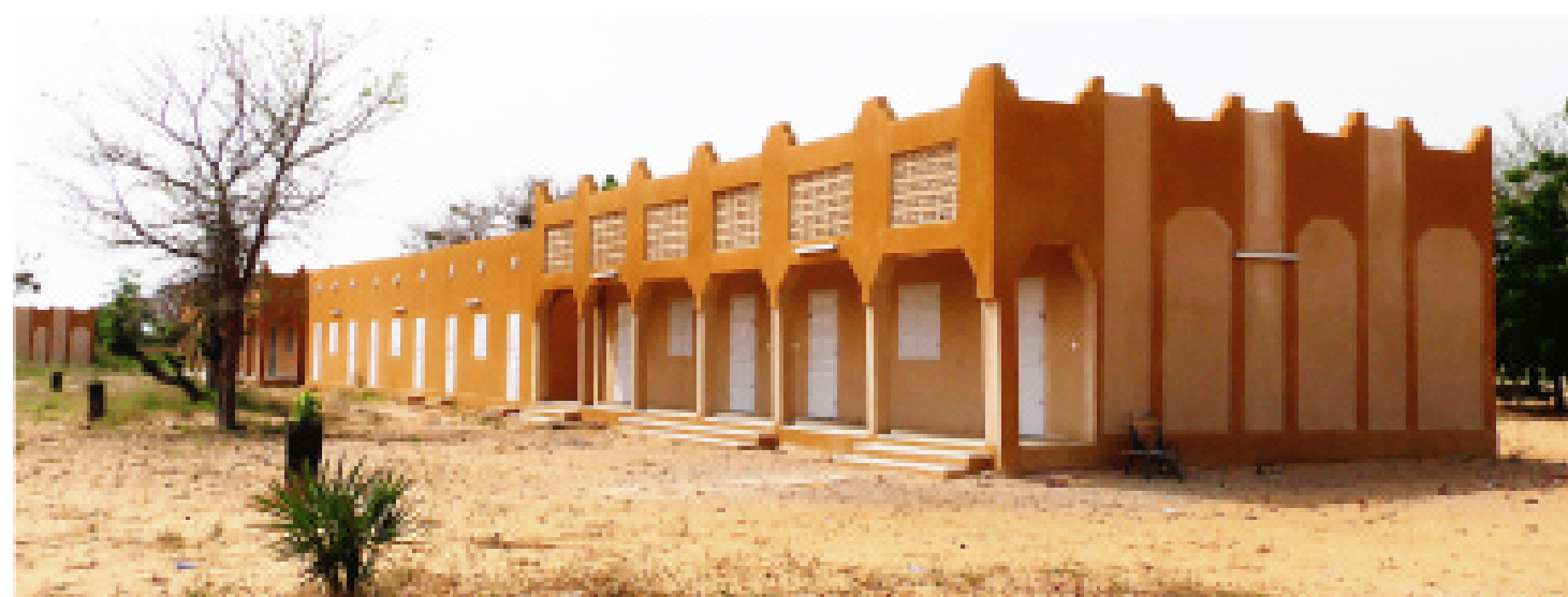
Les nouveaux bâtiments du Lycée Professionnel de Tourisme et d'Hôtellerie d'Agadez restructuré par le PRODEC