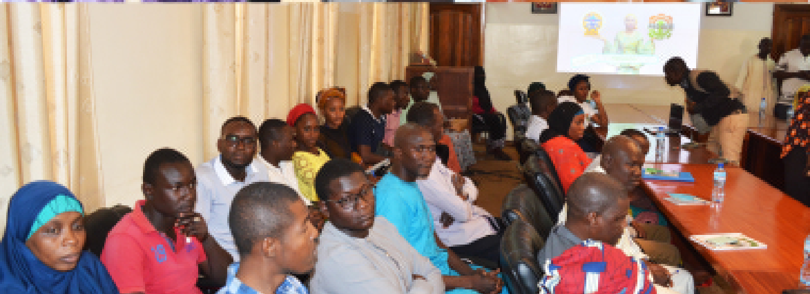
Rencontre entre les bénéficiaires des réalisations du PRODEC et une mission de la Banque Mondiale conduite par le Directeur Principal Education (au milieu-photo en haut)