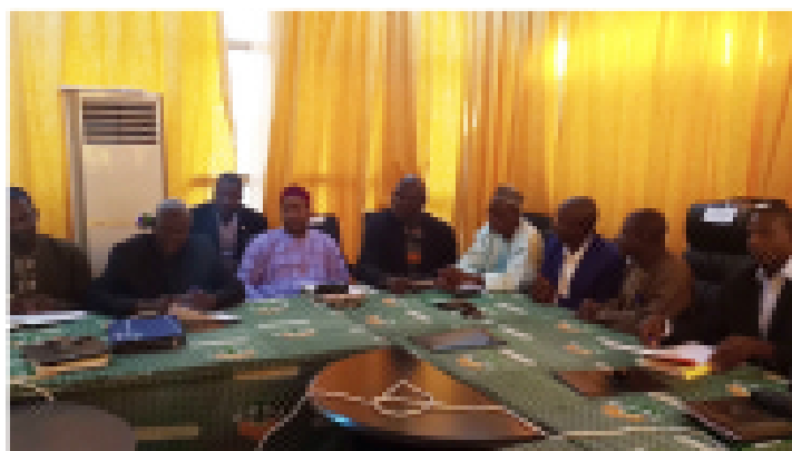
Travaux du 12ème Comité de Pilotage du PRODEC

Sous la présidence de Monsieur le Secrétaire Général du Ministère des Enseignements Professionnels et Techniques, Président du Comité de Pilotage, l'objectif de la 12ème session, qui s'est tenue dans la salle de réunion du PRODEC, est d'adopter les projets de documents de pré-bilan 2018 et de Plan de Travail et Budget Annuels (PTBA) au titre de l'exercice 2019 avant sa transmission à l'IDA pour avis de non objection.