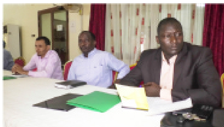
Les représentants des entreprises lors de l'atelier d'identification des filières de formation de reconversion de l'ANPE et du PRODEC

Au total, 60 jeunes diplômés du niveau supérieur dans les domaines des soins infirmiers, de l'inspection de travail et de l'ingénierie environnementale seront reconvertis en des spécialistes en santé et sécurité au travail.