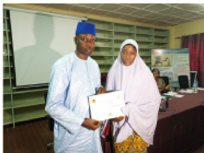
Remise d'attestation à une jeune dame formée à la demande au CNES par le Secrétaire Général du FAFPA

Avec un taux de réussite de 100%, les jeunes formés se disent satisfaits de la formation reçue et sont confiants, car ils sont désormais dotés des compétences opérationnelles pour faire face à toutes les exigences de leurs métiers.