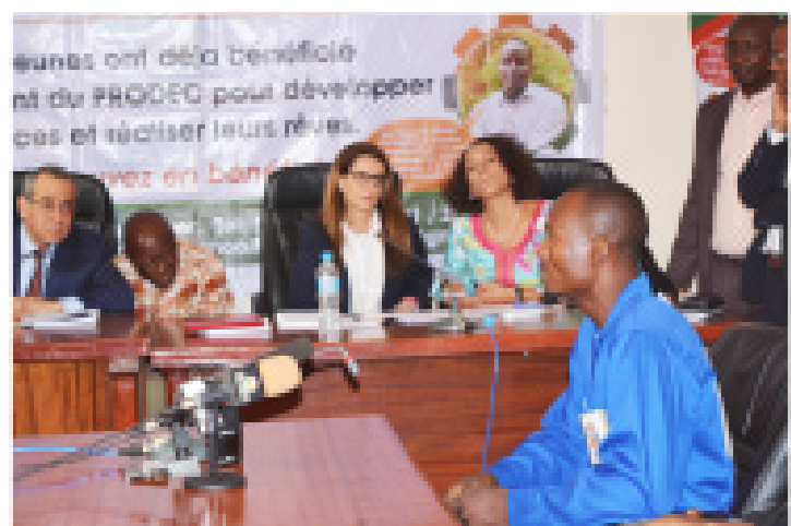
Témoignage d'un bénéficiaire du PRODEC lors de la rencontre avec la mission éducation de la Banque Mondiale

La rencontre a été marquée par la présence de plusieurs bénéficiaires du PRODEC formés et accompagnés à travers l'Agence Nationale pour la Promotion de l'Emploi (ANPE), le Fonds d'Appui à la Formation Professionnelle et à l'Apprentissage (FAFPA) et la Chambre de Commerce et d'Industrie du Niger (CCIN).