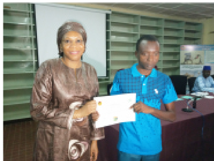
Remise d'attestation par la DG du Centre National d'Énergie Solaire (CNES), à un jeune formé à la demande

Cette demande a été lancée par l'AMN afin d'avoir les ressources humaines nécessaires pour assurer la maintenance des dispositifs solaires installés par un projet d'électrification rurale dans une centaine de localités de Maradi, Zinder, Diffa et Agadez.