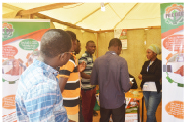
Des jeunes attirés par le stand du PRODEC lors de la foire de l'emploi-Tahoua 2019

La foire a été organisée par le CIPMEN avec le soutien de l'OIM, de la délégation de l'UE et de plusieurs autres partenaires.