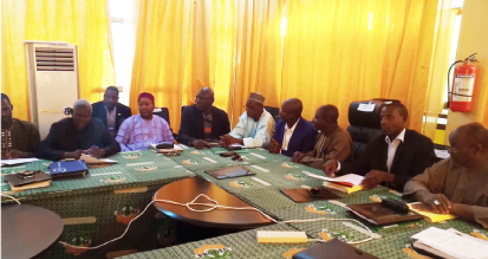
Travaux d'une session extraordinaire du Comité de Pilotage du PRODEC pour la validation des 10 communes d'implantation des Sites d'Apprentissage Agricole (SAA)