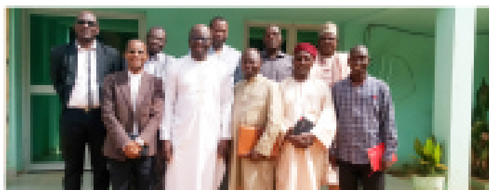
Rencontre entre l'équipe du PRODEC et celle de l'ANSI