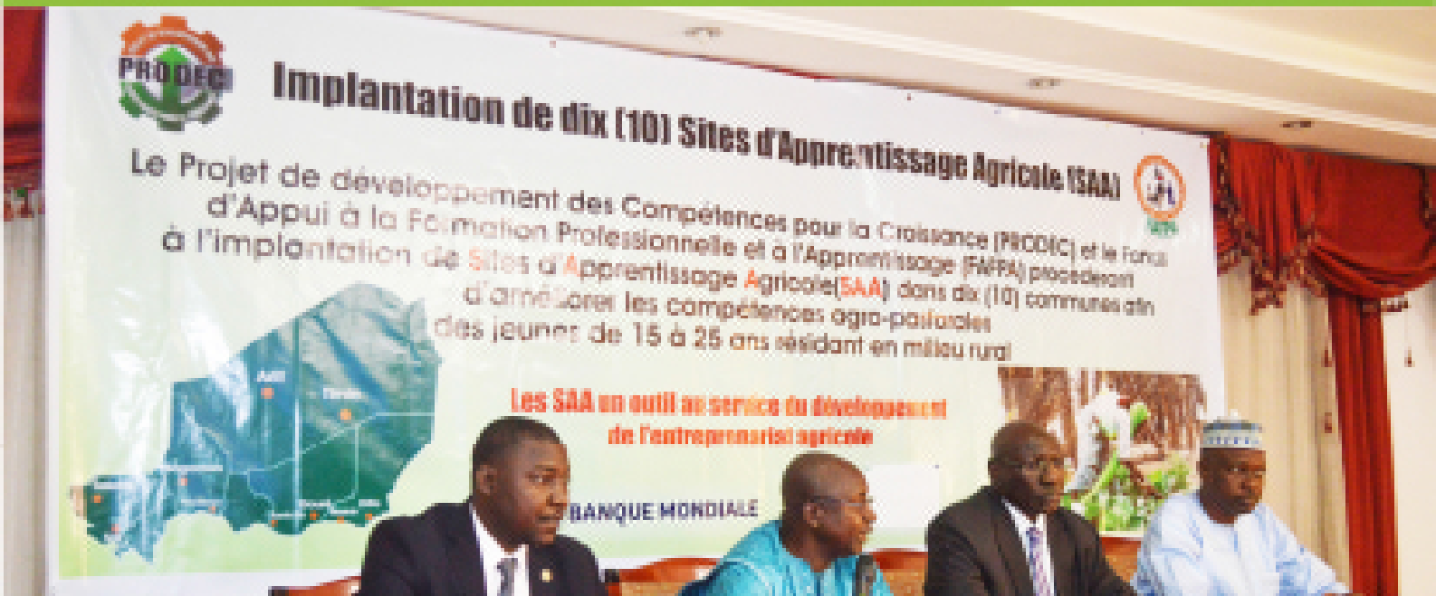
Atelier National de dissémination du concept des Sites d'Apprentissage Agricole (SAA)