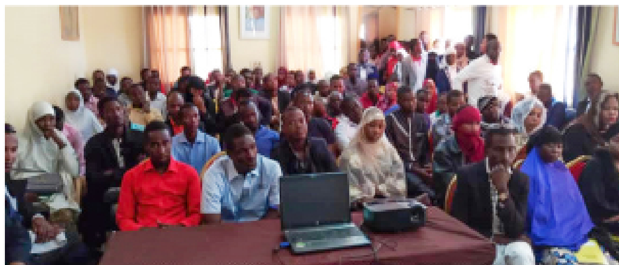
Des jeunes sensibilisés sur les formations en entrepreneuriat et la CPA qui sera organisée par le PRODEC via la CCIN Agadez 2019