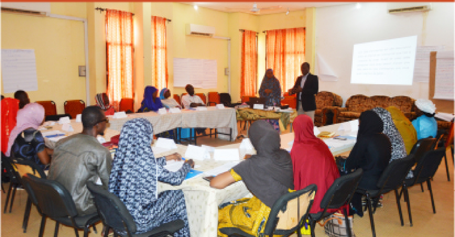
Formation des jeunes diplômés en entrepreneuriat par le PRODEC à travers la CCIN – Niamey 2018