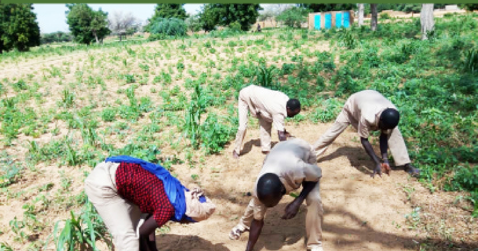
Des jeunes formés par le PRODEC dans le domaine Agricole à travers le FAIPA