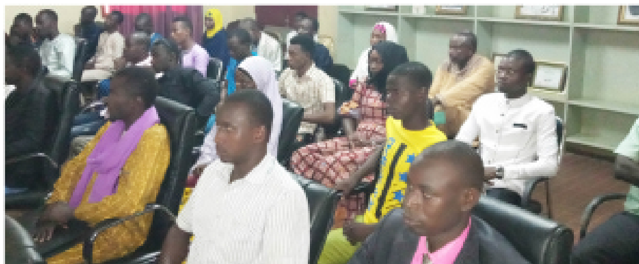
Des jeunes formés à la demande par le PRODEC via le FAIPA – Niamey 2018