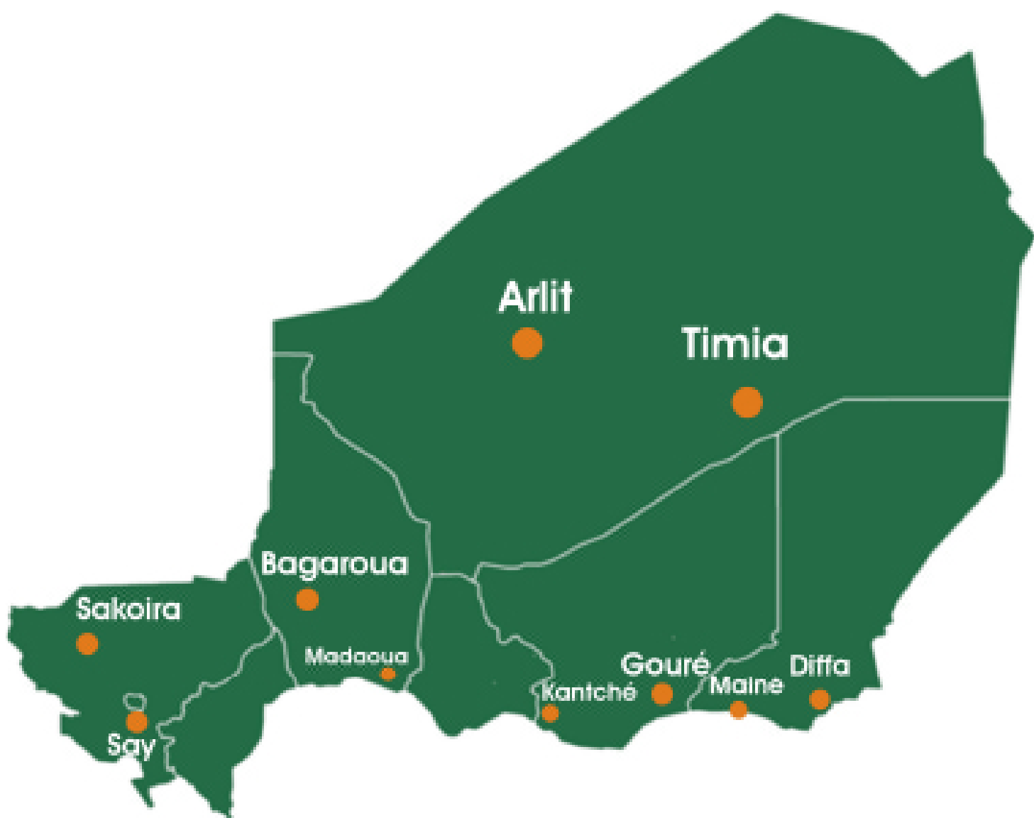
Les dix communes sélectionnées pour l'implantation des Sites d'Apprentissage Agricole (SAA)

- Poursuite du mécanisme de l'apprentissage par alternance en milieu urbain pour une cible de 500 nouveaux jeunes.